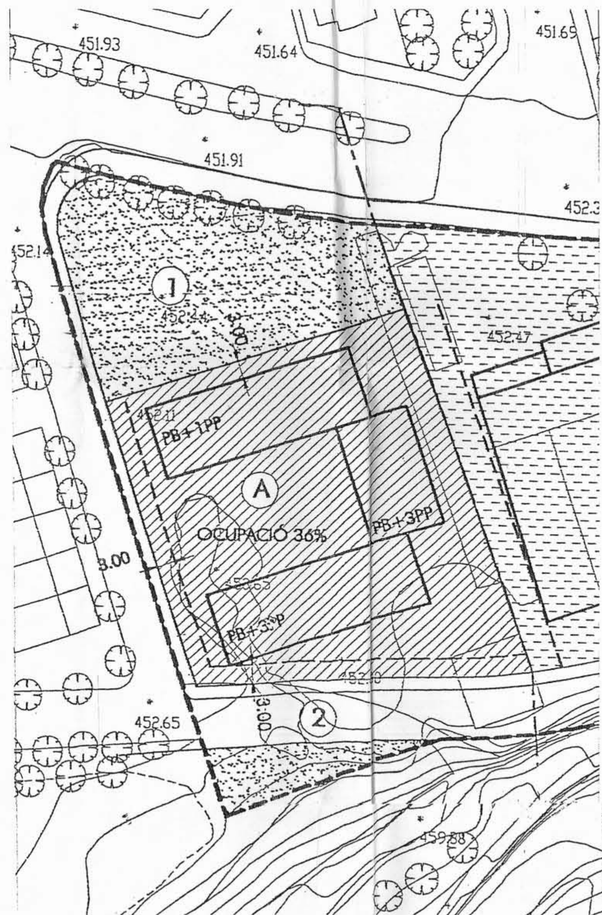
SUPERFÍCIES SEGONS MODIFICACIÓ P.G.