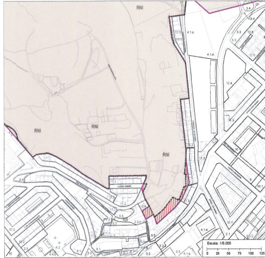
NORMATIVA URBANÍSTICA - SÒL NO URBANITZABLE - POUM 2006 Text Refós