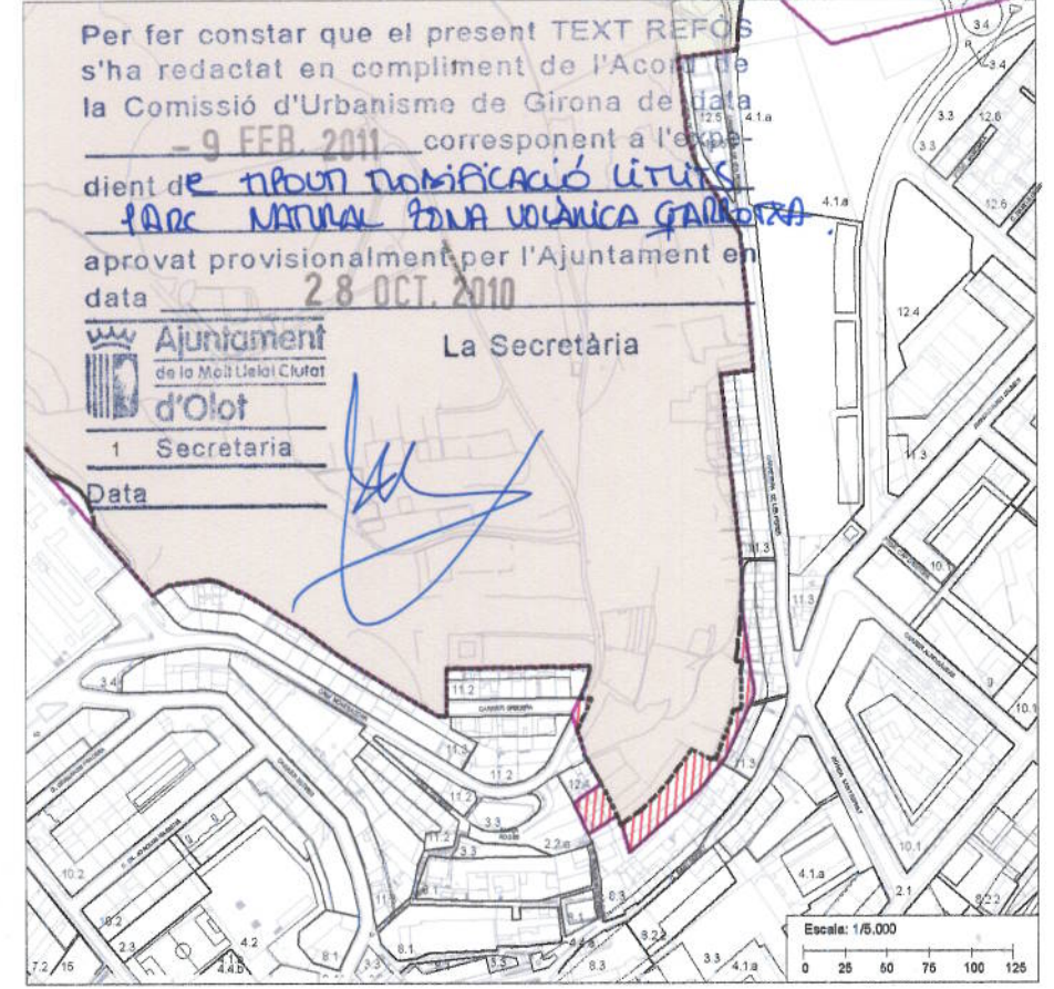
NORMATIVA URBANÍSTICA - PLA ESPECIAL DE LA ZONA VOLCÀNICA DE LA GARROTXA

--- LÍMIT P.E.Z.V.G. --- LÍMIT URBÀ + URBANITZABLE (POUM) [Red hatched] Sòl no urbanitzable (POUM) [Red hatched] Zona: Espai Volcànic Representatiu: RNI