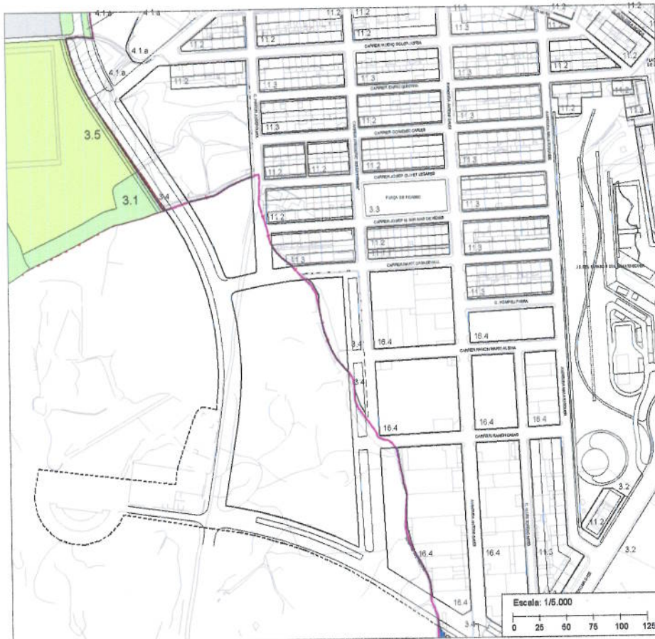
NORMATIVA URBANÍSTICA - SÒL NO URBANITZABLE - POUM 2006 Text Refós