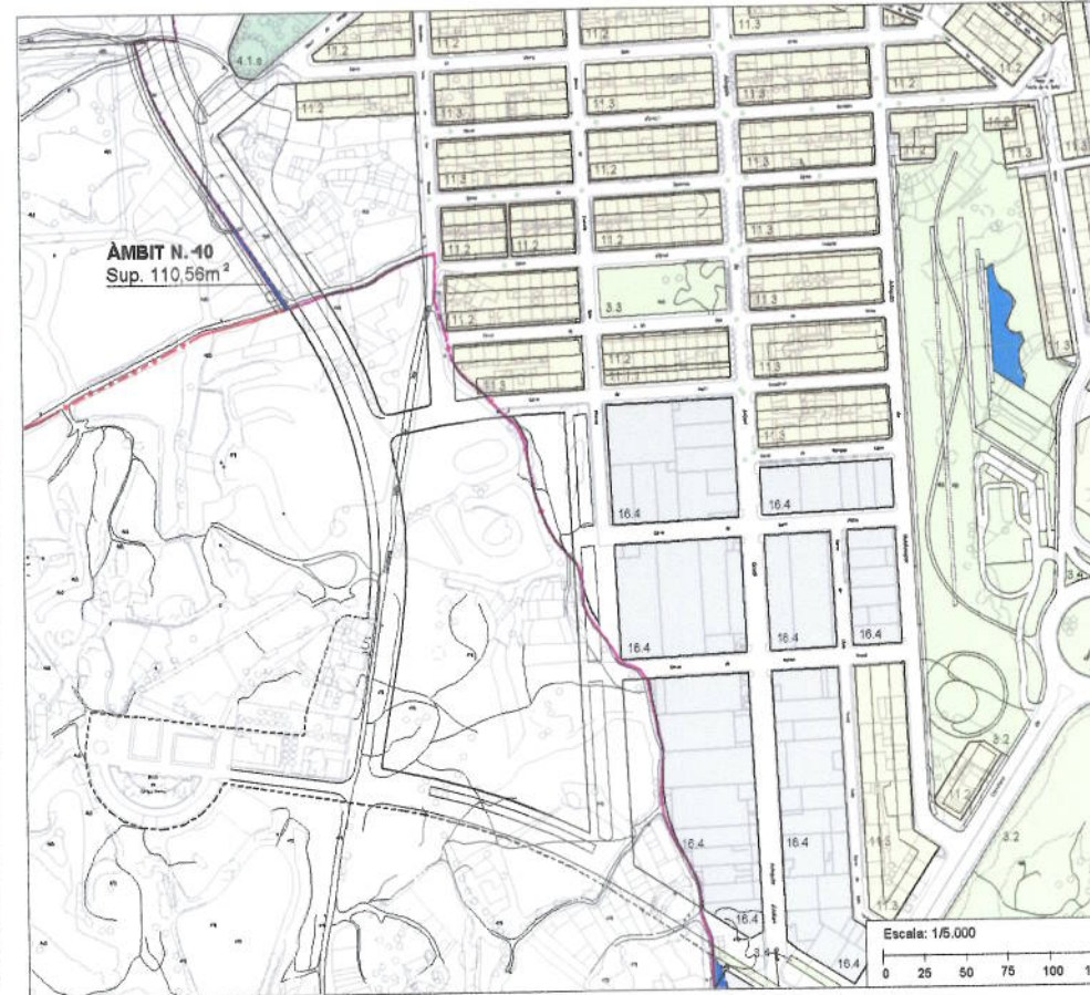
NORMATIVA URBANÍSTICA - SÒL URBÀ - POUM 2006 Text Refós