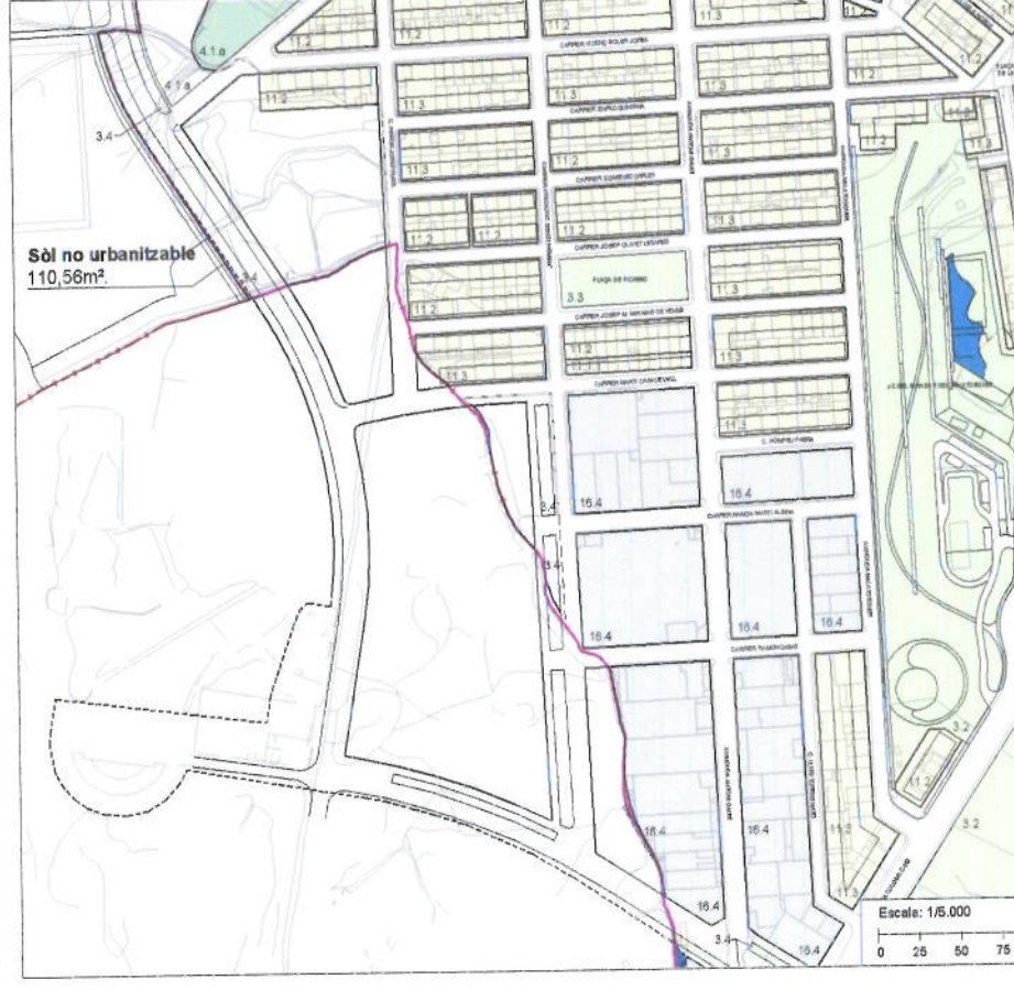
PROPOSTA D'ORDENACIÓ SÒL URBÀ

24 MARÇ 2011 ÀMBIT NÚM. 10 S'ajusta el límit de la reserva natural en la zona situada al límit entre els municipis d'Olot i Les Preses, en la zona oest del barri de Sant Roc. Afecta al sector de sòl urbanitzable delimitat i concretament als terrenys de reserva per a la construcció del nou traçat de la carretera vella de Les Preses.