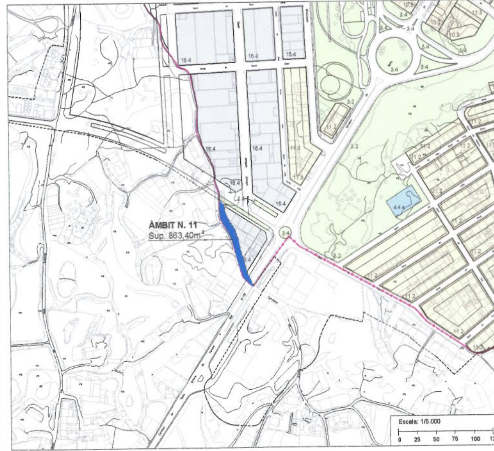
NORMATIVA URBANÍSTICA - SÒL URBÀ - POUM 2006 Text Refós