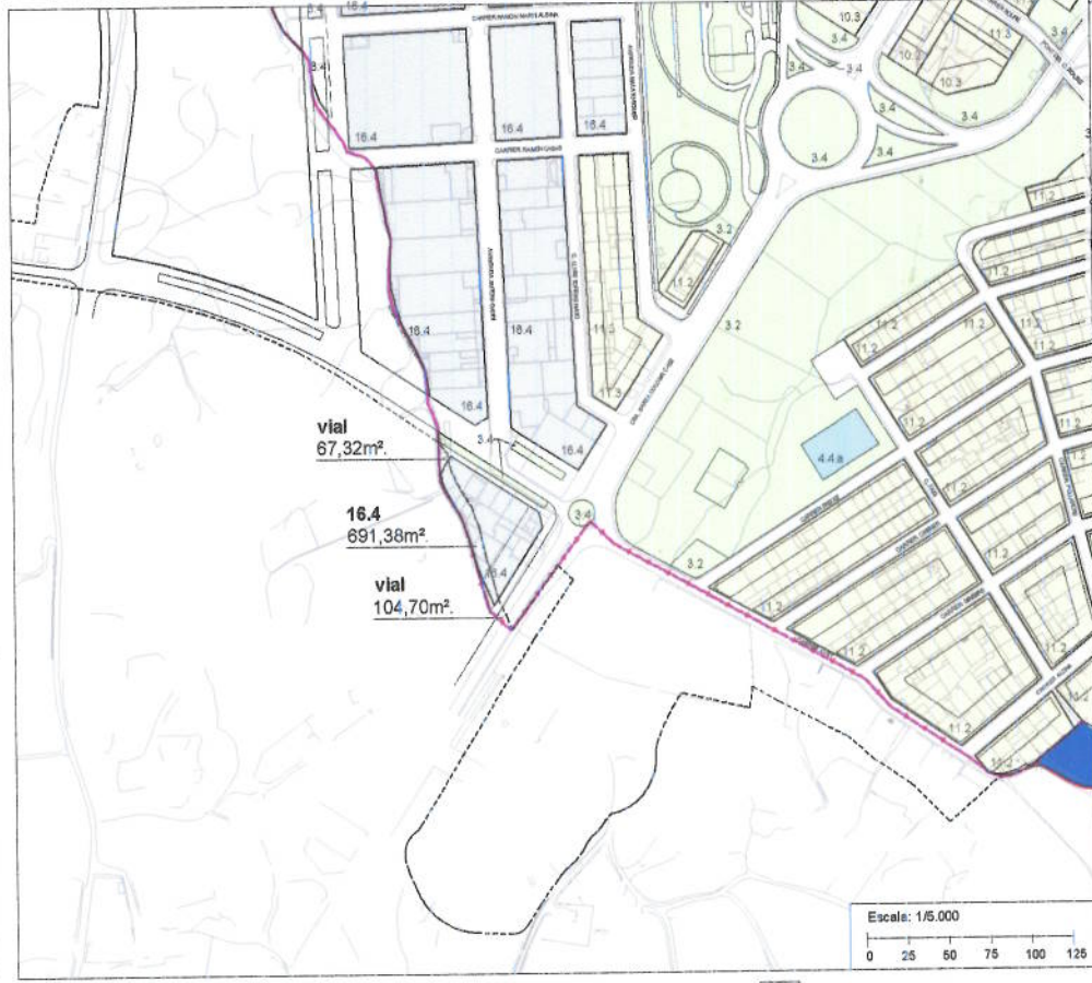
PROPOSTA D'ORDENACIÓ SÒL URBÀ