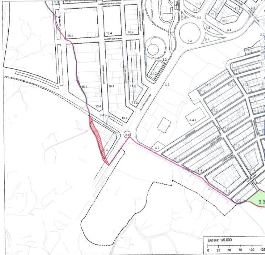
NORMATIVA URBANÍSTICA - SÒL NO URBANITZABLE - POUM 2006 Text Refós