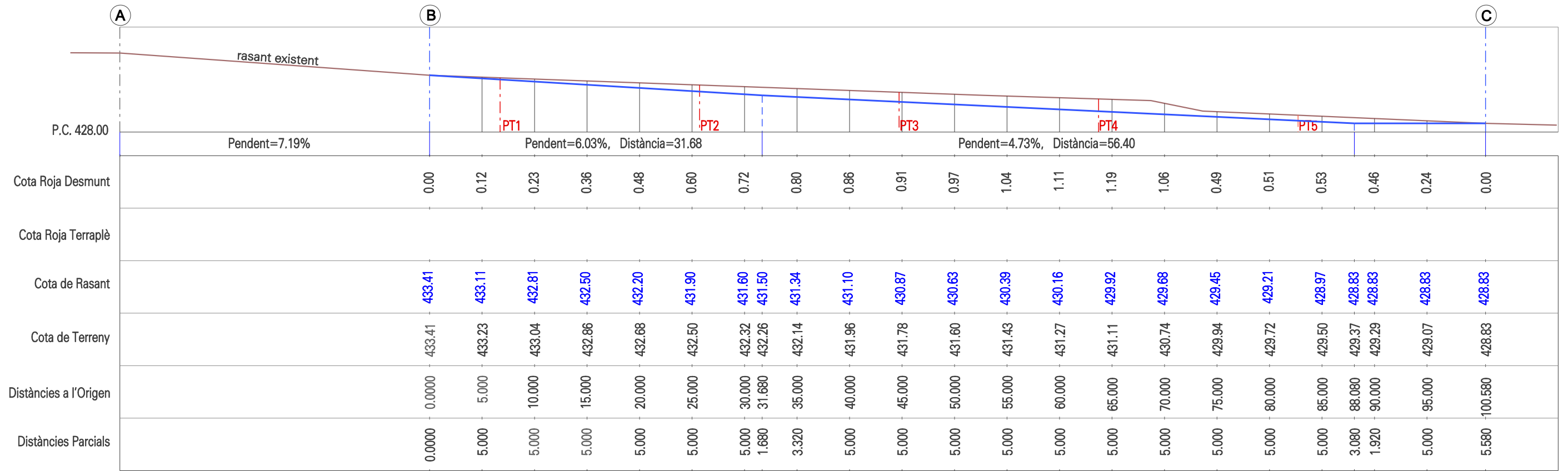
PERFIL LONGITUDINAL A-B-C