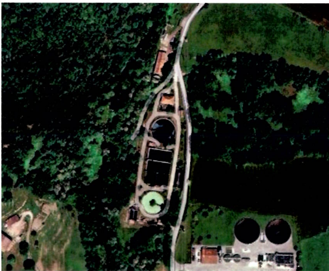
La Depuradora Vella d'Olot, dins l'espai lliure de Parc Urbà i Ribes del Riudaura

Per tant, es dona compliment al que estableix l'article 98 del decret Legislatiu 1/2010 (LLUC), sobre la garantia del manteniment de la superfície d'espais lliures i de la funcionalitat dels sistemes objecte de la modificació.