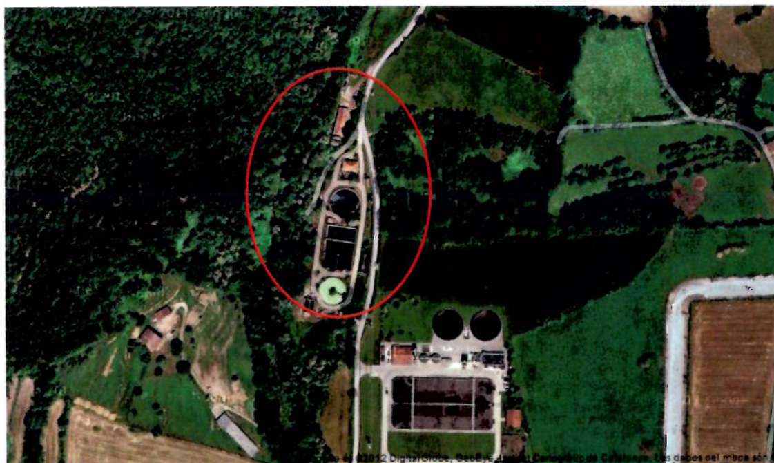
la Depuradora Vella d'Olot

La superfície de l'àmbit es de 8.532,16 m2 . Aquest sòl es discontinu, separat per un camí d'accés a la riera està ocupat per els edifici i diverses instal·lacions de la depuradora vella d'Olot. S'hi accedeix directament des de la carretera de les Feixes, abans d'arribar a la Capella de l'Esperança, en el límit nord del terme municipal d'Olot, i amb un portal diferent per a cada subespai.