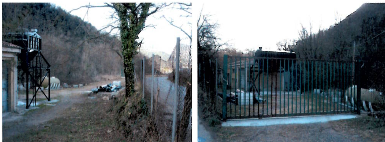
la part de la depuradora Vella no recollida com instal·lacions d'aigües residuals

I disposar a la part de la Depuradora Vella que ja està considerada dins el sistema d'infraestructures dels serveis urbanístics, que siguin només instal·lacions d'aigües residuals clau 5.4, aquells sòls ocupats realment per instal·lacions, deixant dins el sistema d'espais lliures, aquelles que tenen les característiques i elements vegetals-naturals igual com el sòl d'espai lliure del voltant.