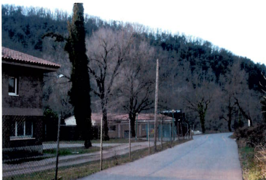
les instal·lacions de la depuradora Vella: una part qualificada de clau 5.4 i l'altre de clau 3.1 ( la part del fons)

El Parc urbà de la Riera del Riudaura, en la seva part baixa entre el pont de l'Hostal del Sol i la capella de l'Esperança, es defineix com a parc per :