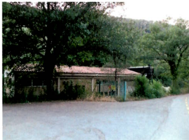
La Depuradora Vella amb accés des de la ctra. De Les Feixes a les dues subzones