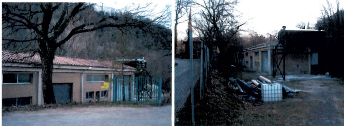
La depuradora vella qualificada ara de Parc Urbà i que es vol modificar