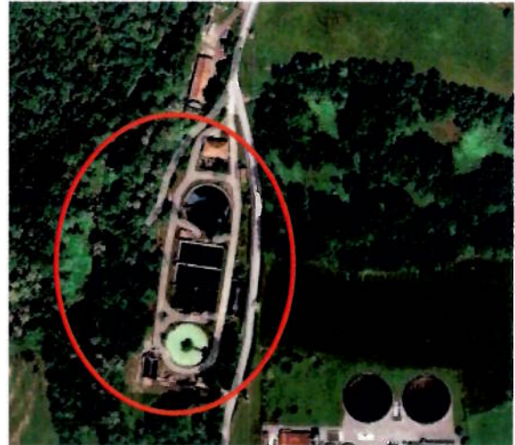
la sub-zona delimitada que es pretén modificar de qualificació i la subzona amb elements dels espais lliures

L'àmbit de la present modificació es situa d'una banda, en la part nord de les parcel·les de sòl públic, on es localitzen part de les instal·lacions de la Depuradora vella, i tal com es pot constatar en el document gràfic, no té els elements que defineixen els parcs urbans i les ribes del Riudaura, perquè es una clariana edificada i ocupada.