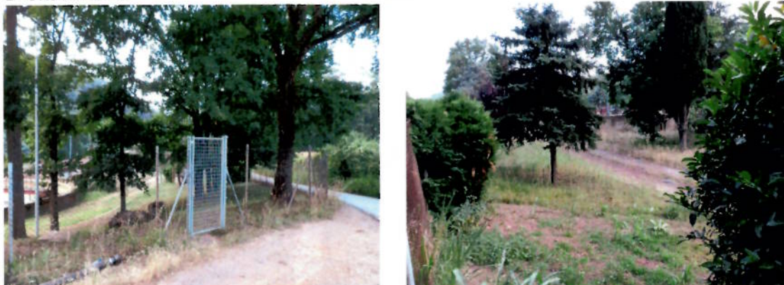
Espais lliures dins la zona qualificada de clau 5.4