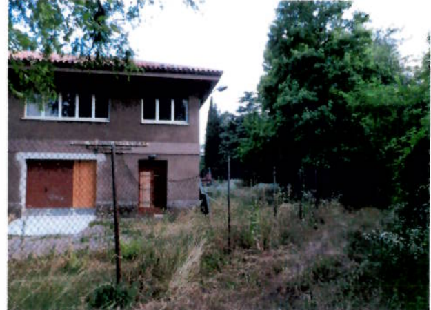
La part de la Depuradora Vella que te elements del sistema d'Espais Lliures