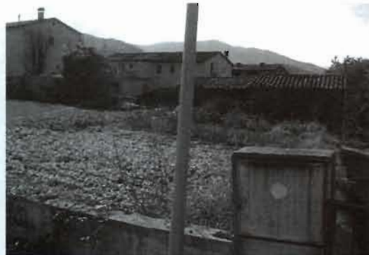
Solar c/ Rosa dels Vents núm. 21

Modificació P.A: 08.01 c/ Rosa dels Vents Text Aprovació inicial