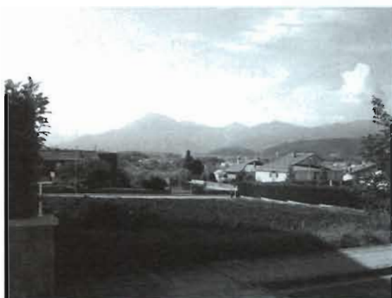
Solar municipal c/Ponent núm. 5

El terreny propietat de l'Ajuntament d'Olot, en virtut del projecte de reparcel·lació del polígon IV del sector 3 de Batet, s'ha utilitzat com a camp de conreu fins la data present. Està urbanitzat, amb alineacions, rasants i tots els serveis tant pel carrer Rosa dels Vents a la banda sud-oest, com pel carrer de Ponent a la seva banda nord-est.