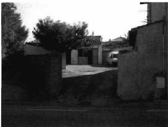
Ctra. Santa Pau 77

La finca de la carretera de Santa Pau 77-79, està consolidada amb diverses construccions. L'edifici alineat a la carretera de Santa Pau, figura amb 3 habitatges i en el pati interior, amb accés des de la mateixa carretera, si localitzen locals de garatge i un taller de fusteria.