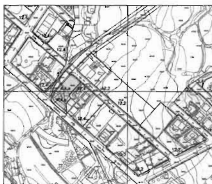
POLÍGON D'ACTUACIÓ P.A: 08.01

La finalitat d'aquest polígon era l'obtenció del sòl públic destinat a equipament comunitari, i la situació de l'aprofitament urbanístic sobre el sòl apte d'esser edificat.