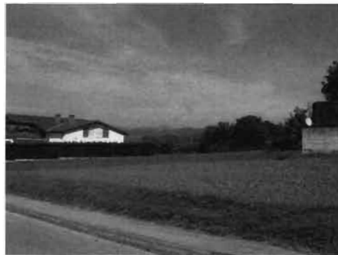
terreny de dotacions comunitàries segons pla parcial 1995 c/ Rosa dels Vents núm. 4