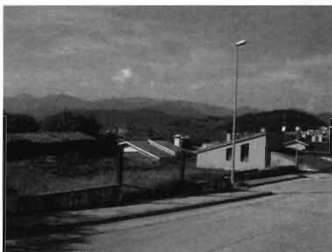
Solars edificables segons ordenació 1990 c/ Rosa dels Vents núm. 19 i 21

El projecte de reparcel·lació del Polígon IV del sector 3 de Batet, fou aprovat definitivament el 17 d'abril de 1997 ( BOP de 17 juny de 1997) . A l'Ajuntament d'Olot se li adjudicà la parcel·la del carrer Rosa dels Vents núm. 4, qualificada de dotacions comunitàries. El 10% d'AM fou cedit amb compensació econòmica , per els propietaris de l'àmbit reparcel·lable, atès que el 10% de l'AM del Polígon no assolia al corresponent a la parcel·la mínima de 800 m 2 .