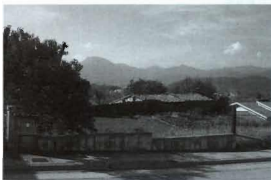
Solar c/ Rosa dels Vents núm. 19

La mateixa situació pel que fa a alineacions, rasants i serveis, a peu de parcel·la, disposen els solars del carrer Rosa dels Vents núm. 19 i 21, atès que amb posterioritat a la declaració de sòl urbà de 1990, es va executar la urbanització d'aquest carrer per conferir la condició de solar a les parcel·les que hi confronten directament a la seva banda sud.