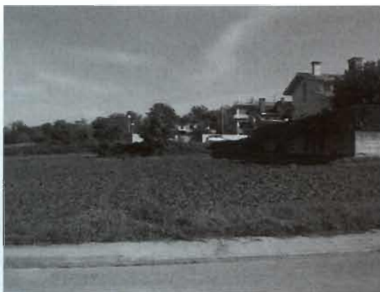
Solar municipal c/ Rosa dels Vents núm. 4

La mateixa situació pel que fa a alineacions, rasants i serveis, a peu de parcel·la, disposen els solars del carrer Rosa dels Vents núm. 19 i 21, atès que amb posterioritat a la declaració de sòl urbà de 1990, es va executar la urbanització d'aquest carrer per conferir la condició de solar a les parcel·les que hi confronten directament a la seva banda sud.