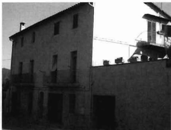
Ctra. Santa Pau 79