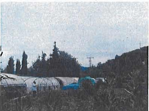
ZONA HORTS, MUR LÍMIT VEÍ