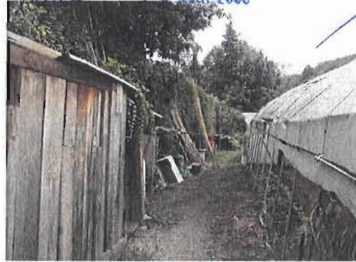
ZONA HORTS, LÍMIT VEÍ