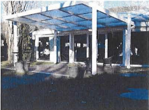
CARPA EXISTENT ACCÉS