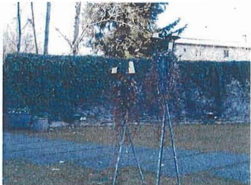
MUR LÍMIT VEÍ